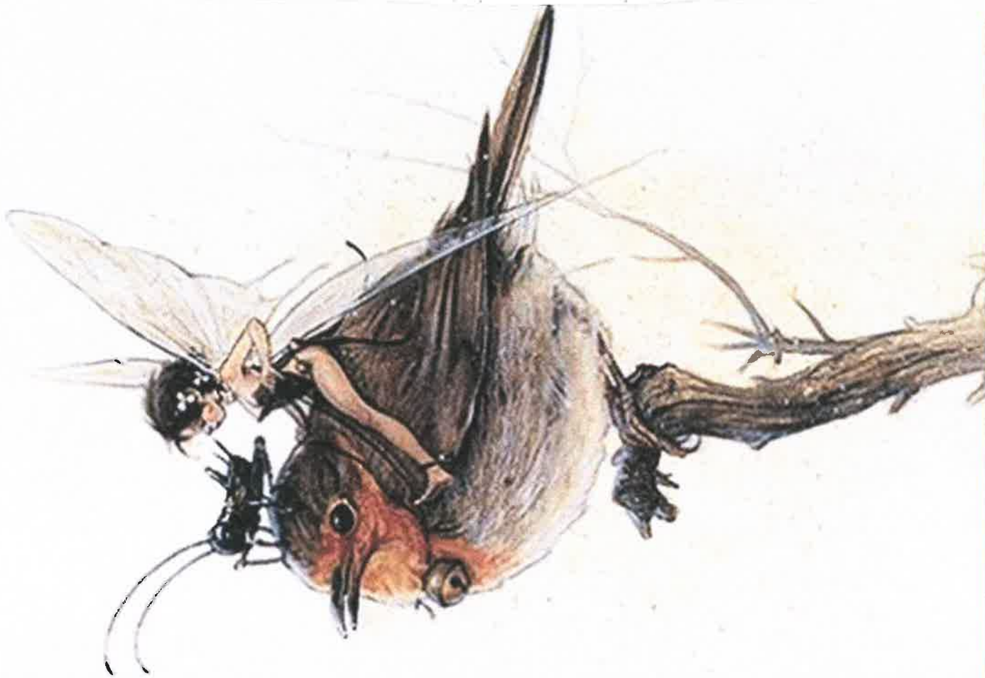
Fée des arbres