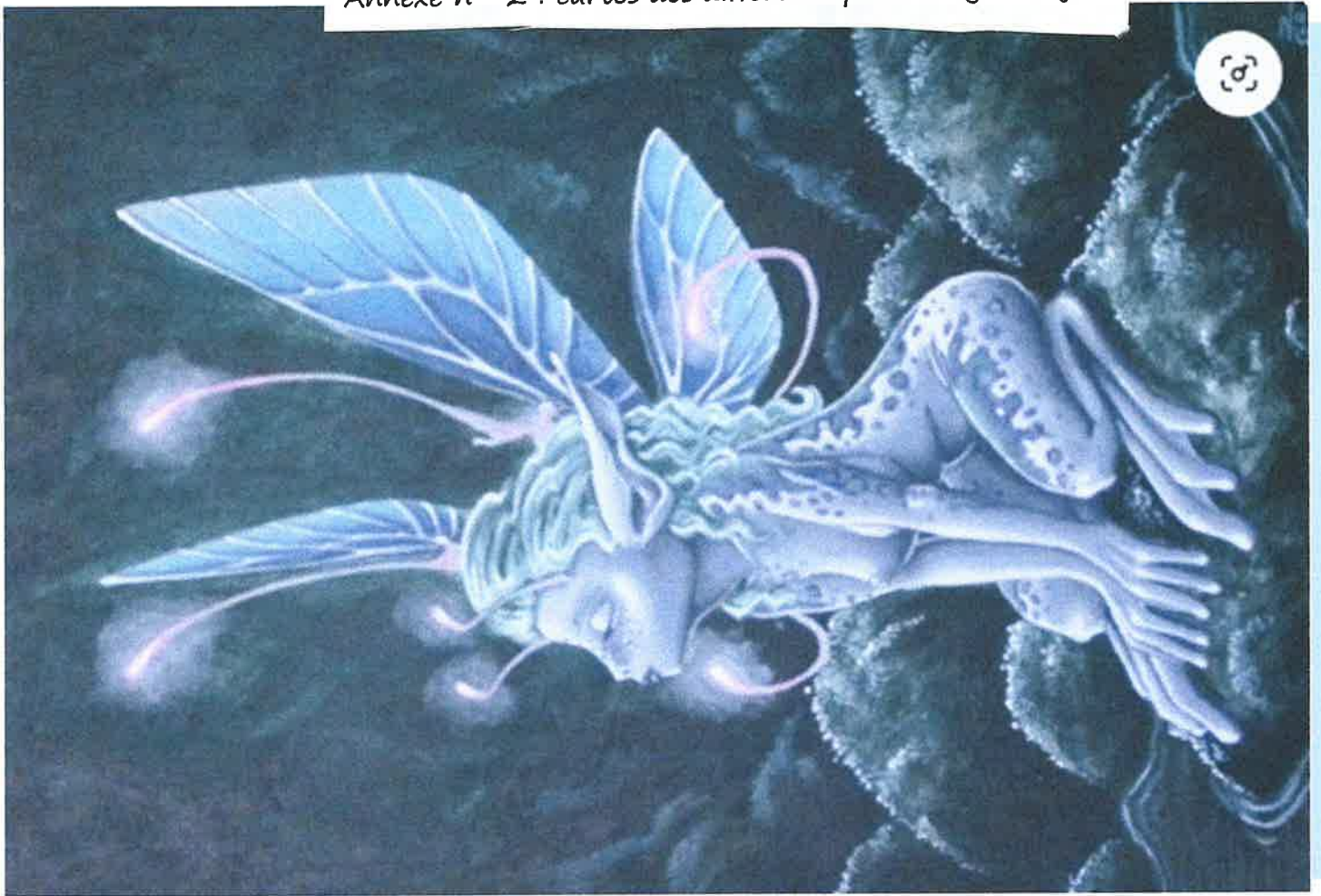
Fée de l'eau