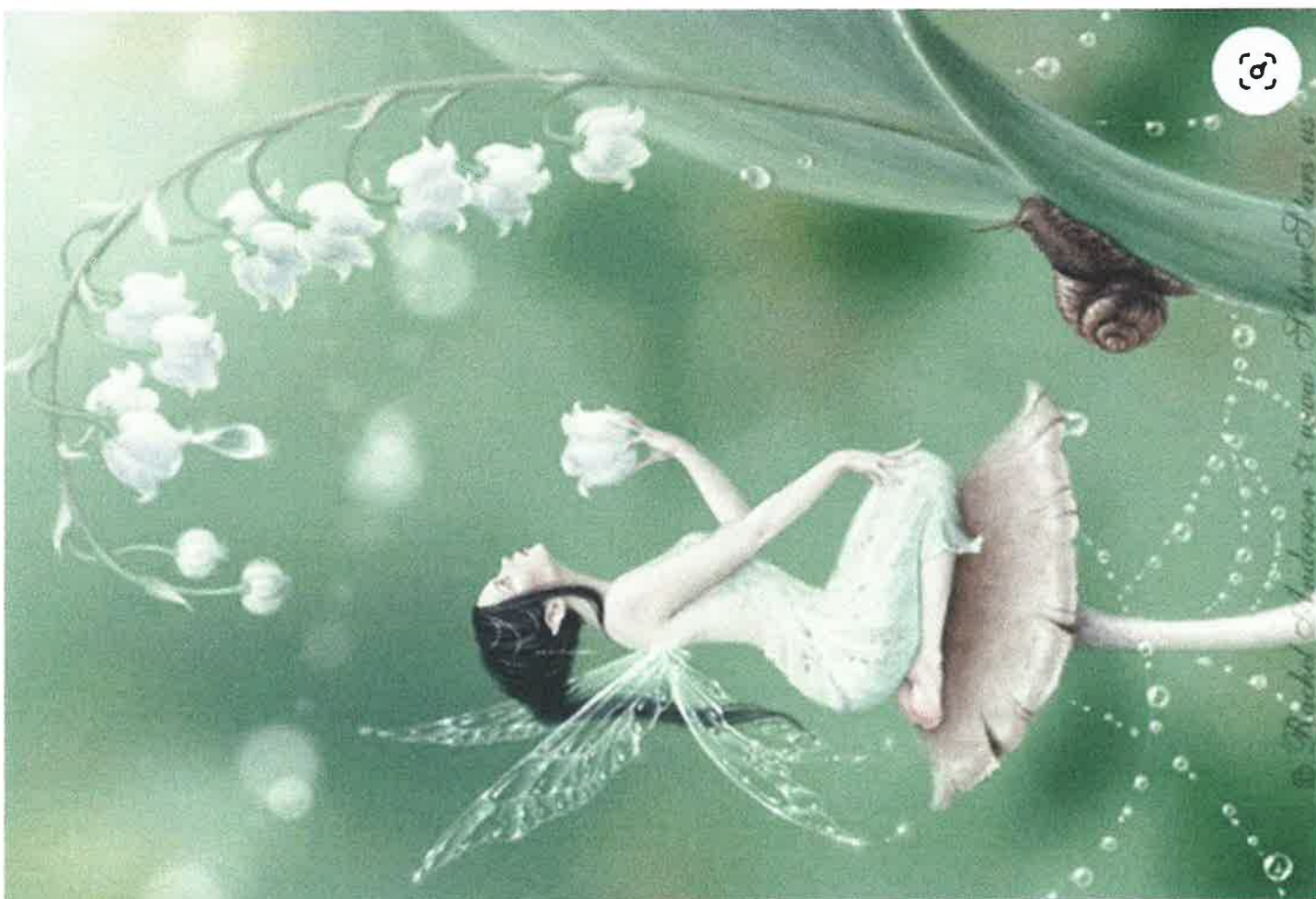
Fée des fleurs