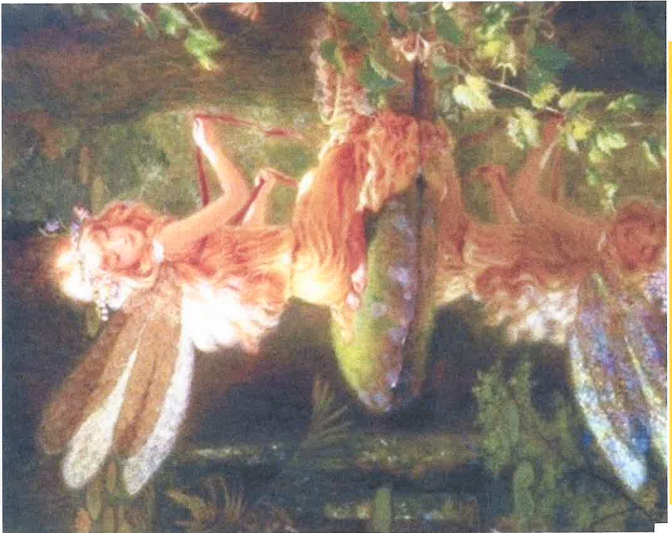
Fée du potiron